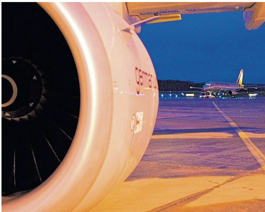
Der Nachtflugverkehr stört mit seinem Lärm den Schlaf Hennefer Anwohner.

Das bedeutet: Auch die Lärmbelastung ist durch die Zunahme der Nachtflüge nach oben gegangen. Das zeigen die Dauer-