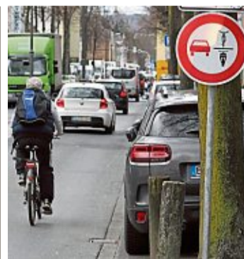
Ein Verkehrsschild weist auf das Überholverbot hin.

Die Zunahme verteilt sich unterschiedlich über das Stadtgebiet. Bei den nächtlichen Landeanflügen gab es ein Plus von rund 50 Prozent auf 9923 Überflügen. Besonders im Südosten mit Uckerath, Lichtenberg, Bieth und Hüchel werden sie als störend empfunden. Dort ist die Überflughöhe durch die 135 Meter höhere Ortslage nahezu identisch zu der im Stadtzentrum. Außerdem liegt dort der Einstieg zum Instrumenten-Anflug-System (ILS) der Landebahn 32. Viele Flugzeuge sind dort im Kurvenflug, und die Piloten erhöhen die Turbinendrehzahl, um auf Landekurs zu kommen. Die Anzahl der Starts in der Nacht nach Osten und Westen ist dagegen nahezu konstant geblieben.